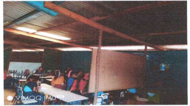
Foto 2: se subirá un metro de altura de la pared debido a fuerte calor cuando está soleado el día, se analiza colocarle salusilla para que haya ventilación.