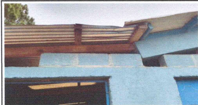
Foto 5: Fotografía en donde se puede notar la necesidad de instalacion de estructura de laminas y laminas troqueladas.