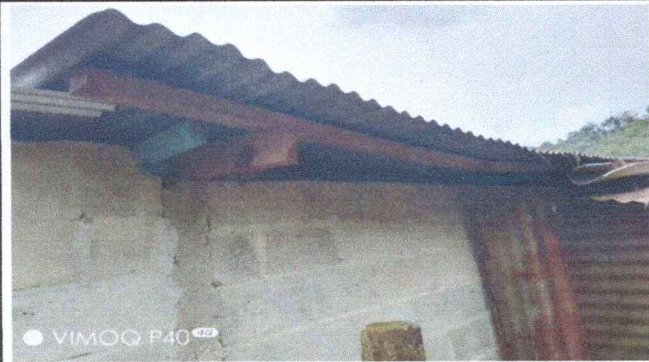
Foto1: Cambio de estructura de techo y techo del salon que se utiliza como aulas. Se cambiará estructura de madera a costanera y laminas estructurales