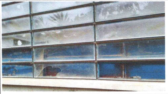
Foto 4: Se cambiará la estructura o marco de vidrios de ventana de aula donde han quebrado vidrios, colocarle vidrio